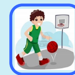
LES JEUX SPORTIFS