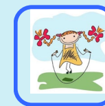
LA COUR DE RÉCRÉ